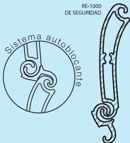
RE-1000 DE SEGURIDAD

Las persianas autoblocantes de aluminio extrusionado enrollables son un sistema de máxima seguridad, aplicables a todo tipo de ambientes. Tienen un sistema mediante el cual, cuanto más fuerza se ejerza para levantarla desde el exterior, ésta más se bloquea ya que posee dos puntos de trabado por cada lama. Estas cortinas están disponibles en varios colores y debido a su peso requiere de un accionamiento automatizado, volviéndolas un producto muy confortable, además de seguro.